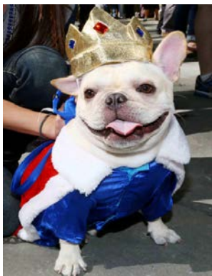
Défilé des bouledogues français sur Time Square