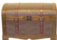
une vieille malle

Mais moi, je n'y viens plus. Au cours des vingt dernières années, je n'y ai pas dormi la moindre nuit, et je l'ai rarement visitée. La dernière fois, c'était il y a sept ou huit ans. De nombreuses personnes m'accompagnaient, elles en avaient fait le tour, elles étaient ressorties aussitôt, et moi avec. J'avais eu le sentiment de m'être cherché moi-même d'une pièce à l'autre et de ne m'être pas trouvé. Pour cette seconde visite, j'étais seul, déterminé à ne pas me hâter et à n'être chassé ni par le froid, ni par la faim, ni par aucune tristesse. Je me dirigeai vers la chambre de mes parents et ouvris le placard désigné par ma mère pour découvrir, derrière les habits accrochés, derrière la rangée d'escarpins, une malle debout contre le mur. J'étais attendu!