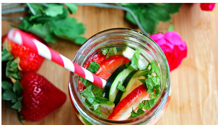
Une "Detox water" avec sa paille....

Les «green smoothies» avaient fait sensation au printemps! Faites place à la «detox water» pour cet été. Cette eau infusée avec des fruits, légumes et herbes aromatiques «fait un malheur» - elle est super populaire - chez toutes celles qui aiment combiner le beau et le bon. Très faciles à réaliser, les «detox water» ont l'avantage de faire du bien au corps et de faire l'impasse sur les sodas trop sucrés et tellement moins fun à présenter. Lisez ce qui va suivre pour réussir votre «detox water».