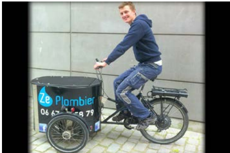
Les plombiers à vélo parcourent jusqu'à 20 kilomètres tous les jours!

Un vélo, ça ne sert pas qu'à pédaler ! On peut aussi y transporter son entreprise. À Nantes, un collectif, Les Boîtes à vélo , réunit plusieurs entreprises qui utilisent le vélo dans leur activité.