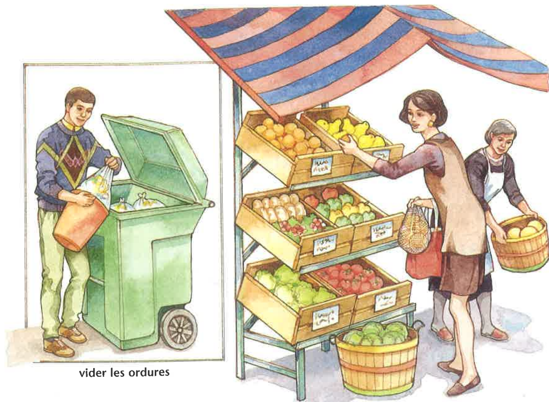
vider les ordures