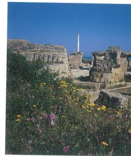
Carthage: les ruines romaines