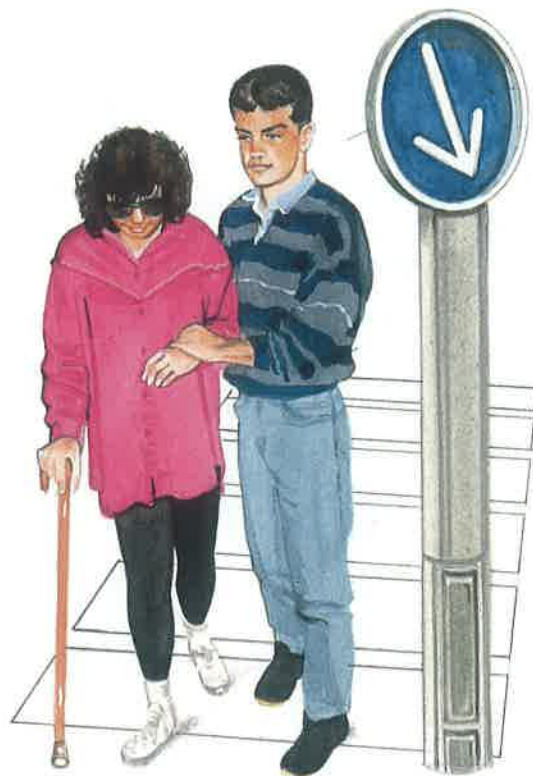
une bonne conduite

avoir la cote être populaire mentir dire quelque chose de faux, ne pas dire la vérité nouer une relation faire une relation l'exigence (f.) l'action d'exiger, de demander impérativement