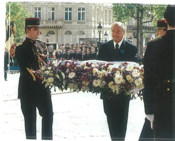
Le 11 novembre au tombeau du soldat inconnu sous l'Arc de Triomphe