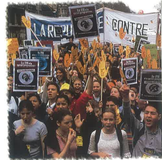
Manifestation antiraciste à Paris