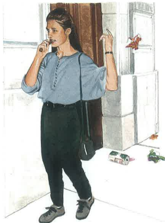
une mauvaise conduite

avoir la cote être populaire mentir dire quelque chose de faux, ne pas dire la vérité nouer une relation faire une relation l'exigence (f.) l'action d'exiger, de demander impérativement