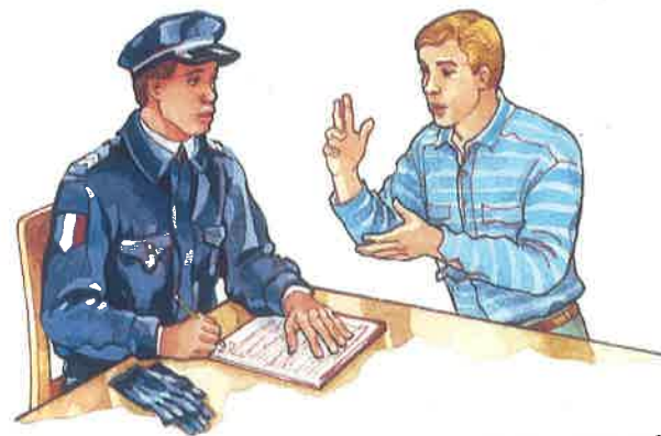
La victime va au commissariat pour déclarer le vol.

un truc ce qu'on fait pour tromper, duper quelqu'un se rendre compte réaliser, comprendre